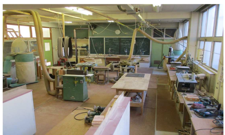
機械・電動工具室