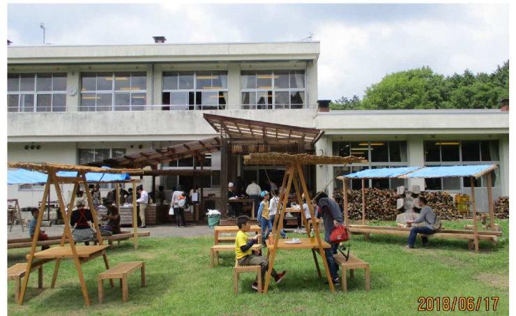
南口テラス側芝生広場(木エフェア)