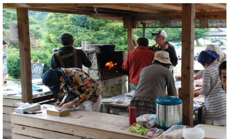
南口テラスピザ窯コーナー(木エフェア)