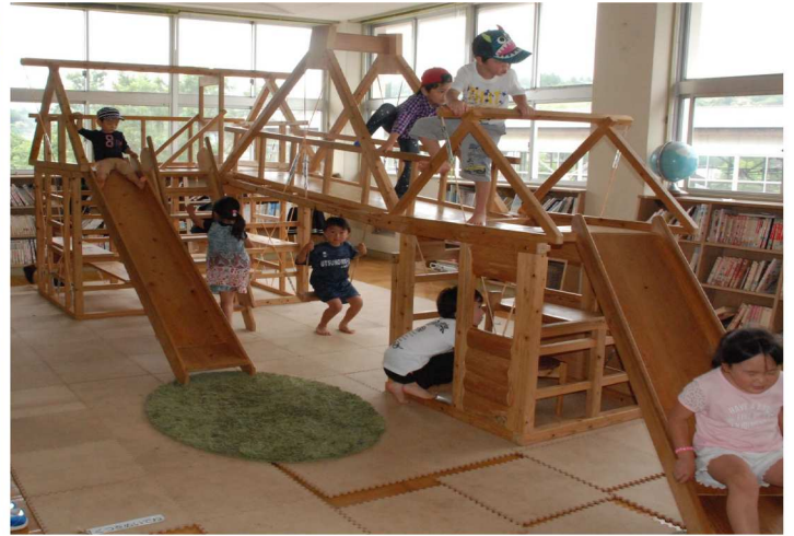
大型遊具コーナー