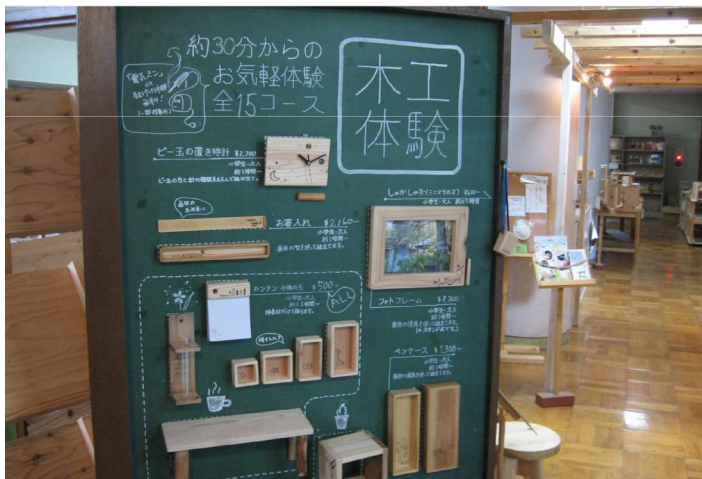
木工体験コーナー