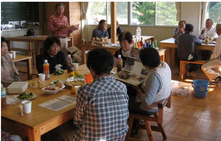
休憩交流室(お茶会)