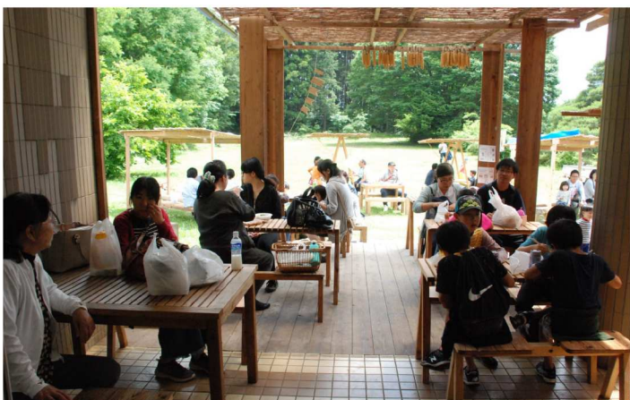
南口テラス(木エフェア)