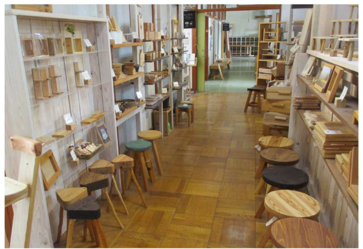
小物品販売エリア