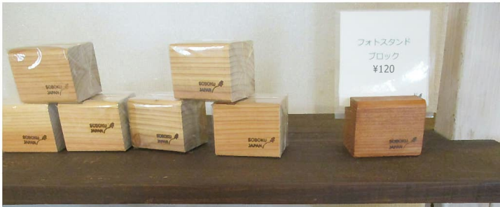
フォトスタンド(小)