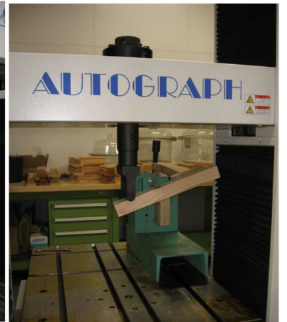
材料強度（曲げ・ねじり）試験